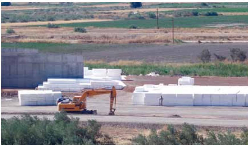
El EPS es una solución idónea en proyectos en los que pueden producirse asentamientos

El EPS se puede emplear en muchas aplicaciones constructivas como, por ejemplo, aligerante en proyectos de ingeniería civil o como relleno ligero en la construcción de carreteras y ferrocarriles.