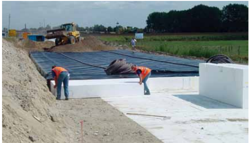
El poliestireno expandido o EPS se emplea como relleno ligero

Por otra parte, los materiales de relleno pesados tradicionales como